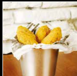
• JALAPEÑO 5€ • 5 pièces