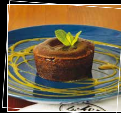
• MOELLEUX AU CHOCOLAT 4€70 •