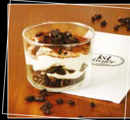
• TIRAMISU OREO 4€90 •