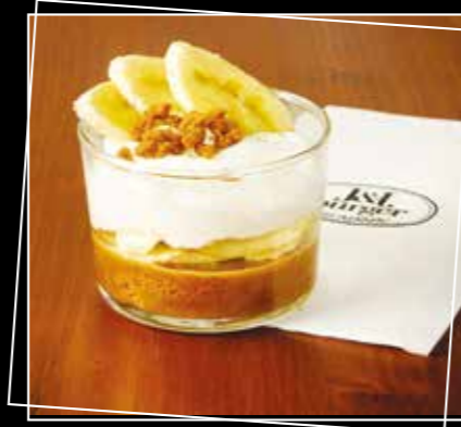
• BANOFFEE 4€90 •