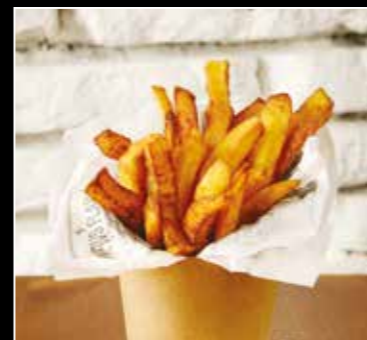
• FRITES MAISON 2€50 •