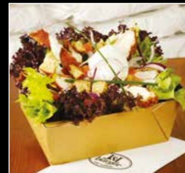
• SALADE CAESAR 13€50 • Filet de poulet pané au panko* salades, tomates, œuf mollet, croutons de pain, sauce Caesar, copeaux de parmesan