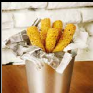
• MOZZARELLA STICKS 4€90 • 5 pièces