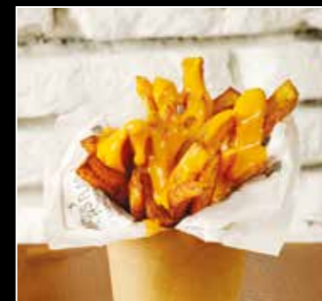
• FRITES MAISON SAUCE CHEDDAR 3€ •