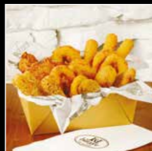
• BOITE A PARTAGER 14€90 • 20 pièces 3 nuggets de poulet et poulet panés, 3 jalapeños rouges, 3 mozza sticks, 3 cheddar sticks, 8 onion rings