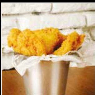
• NUGGETS DE POULET 5€90 • 5 pièces Filet de poulet pané au panko*