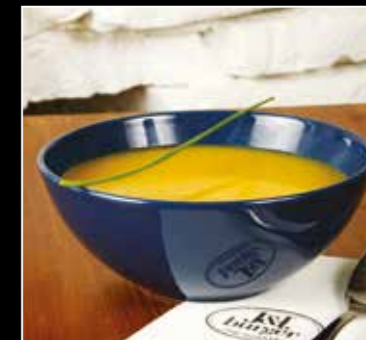
• VELOUTE (selon la saison) 5€ • A agrémenter selon vos goûts en choisissant vos toppings