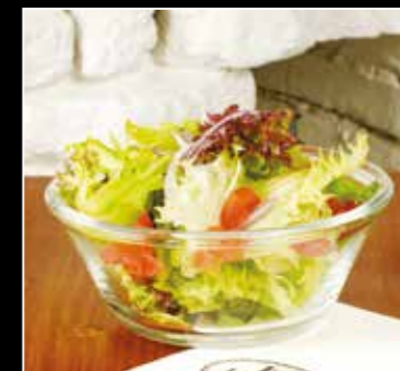
• PETITE SALADE 2€50 •