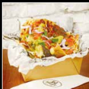
• NACHOS 6€ • tortillas de maïs, guacamole mozza et cheddar fondus