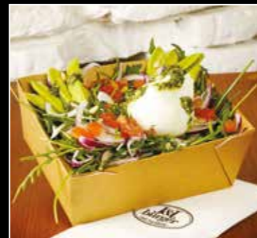
• SALADE BURRATA 13€50 • Burrata, tomates, roquette, avocat oignons rouges, pignons de pins, pesto