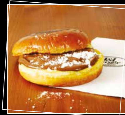
• BURGER PERDU AU NUTELLA AVEC UN FRUIT DE SAISON 5€90 •