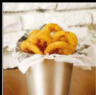
• ONION RINGS 5€ • 12 pièces Beignets d'oignons frits