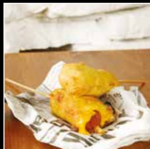
• CORN DOG 6€ • 2 pièces Brochette de saucisse pur bœuf enrobée de cheddar, beignet de farine de maïs, ketchup, yellow moutarde