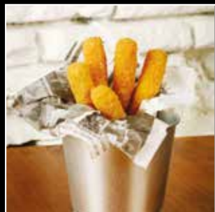
• CHEDDAR STICKS 4€50 • 5 pièces